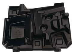
839128-5 Kofferinzet/inlay DPT353