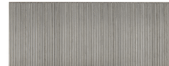
F-31838 Pin 25mm 0,6mm