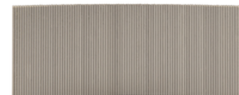
F-32155 Pin RVS 25mm 0,6mm