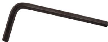
783202-0 Inbussleutel 4,0mm