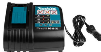
194622-7 Auto oplader LXT DC18SE