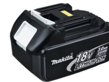
193533-3 Accu BL1830 LXT 18 V 3,0Ah