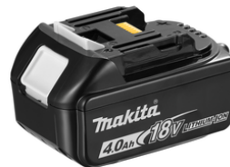
196399-0 Accu BL1840 LXT 18V 4,0Ah