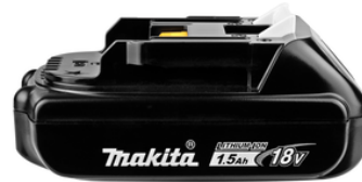
196235-0 Accu BL1815N LXT 18 V 1,5Ah