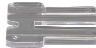
192557-6 Anti-splinterplaat decoupeerzaag