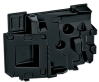
835B51-4 Kofferinzet/inlay DFN350