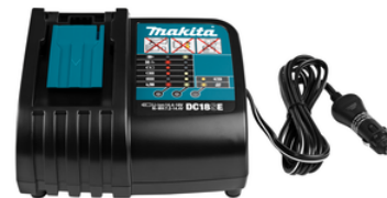
194622-7 Auto oplader LXT DC18SE