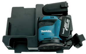
837809-5 Kofferinzet/inlay DBO180