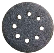
794544-7 Schuurschijf 125mm K120 White