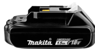
196235-0 Accu BL1815N LXT 18 V 1,5Ah