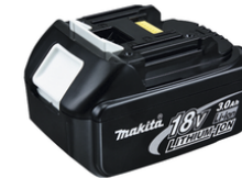
193533-3 Accu BL1830 LXT 18 V 3,0Ah