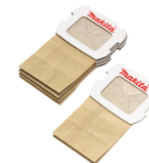
194746-9 Papieren stofzak voor stofbox