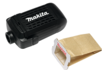
135246-0 Stofbox met papieren stofzak