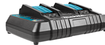
196933-6 Duo snellader LXT DC18RD